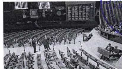
Não há data para a votação da PEC sobre a composição do CNMP

Rosário disse aos deputados ter enviado à Polícia Federal e à Procuradoria-Geral da União relatório que identificou R$ 142 milhões de sobrepreço em licitações e convênios do Ministério do Desenvolvimento Regional. Auditoria da CGU já instaurada após revelação de que o governo Bolsonaro criou o mecanismo de "toma lá, dá cá" para aumentar sua base de apoio no Congresso. "Sobre a denúncia do Estado, realmente, foi ela que deu início ao processo. E aqui até falaram, agradecer, claro, a gente sempre agradece toda reportagem ou ação da sociedade civil, que esse é o papel da imprensa de denunciar casos", afirmou o ministro.