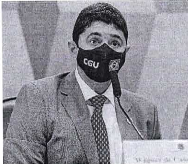
Wagner Rosário falou em esquema de venda de emendas no Brasil

O ministro Wagner Rosário, da Controladoria-Geral da União (CGU), afirmou ontem, em audiência na Câmara dos Deputados, que a sua pasta e a Polícia Federal investigam um esquema de venda de emendas parlamentares, em que deputados e senadores destinariam dinheiro público do Orçamento a prefeituras em troca de um percentual. Ele também disse "não ter dúvida" de que há corrupção na compra de tratores pelo governo via orçamento secreto, caso que foi revelado pelo jornal O Estado de São Paulo e que ficou conhecido como "tratoçorço".